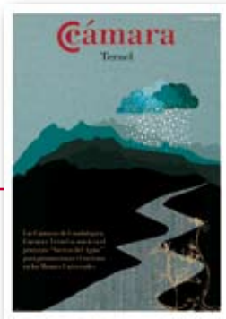
Revista de la Cámara de Comercio e Industria de Teruel N.º 2 AGOSTO 2008